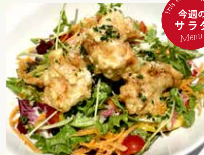
チキンフリットサラダ