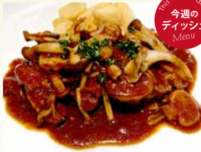
チキンソテーと木ノ子の トマトデミグラスソース