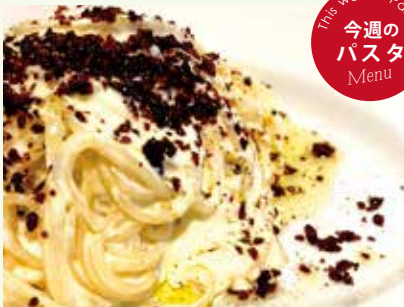
ベーコンのカルボナーラ スパゲティ