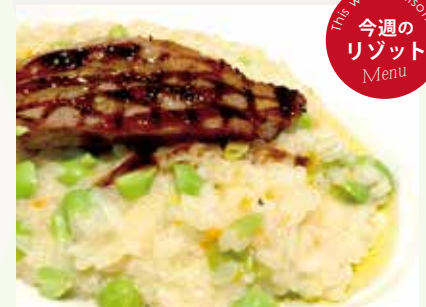
豚バラポルケッタと枝豆の リゾット