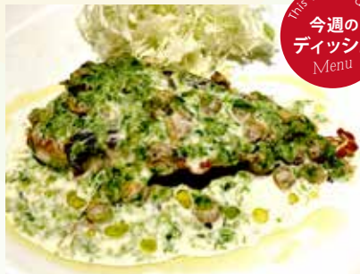
白身魚のソテー 浅利と生のりクリームソース