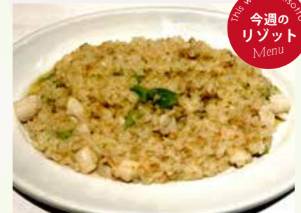
帆立小柱の クリームリゾット