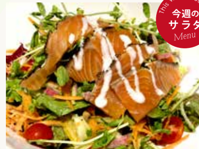
スモークサーモン サラダ