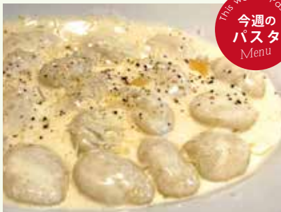
ニョッキクリーム グラナパダーナソース