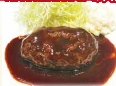
ハンバーグ デミグラスソース or 和風ソース