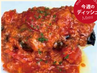
クロムツのソテー トマトチーズソース