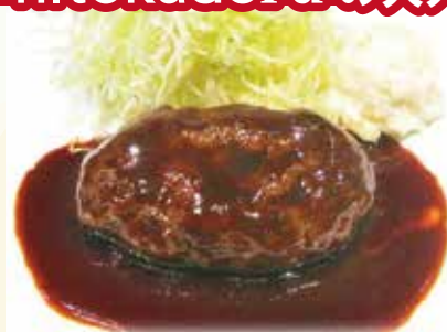
ハンバーグ デミグラスソース or 和風ソース