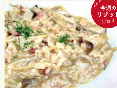
ベーコンと木ノ子の フンドヴォークリームリゾット