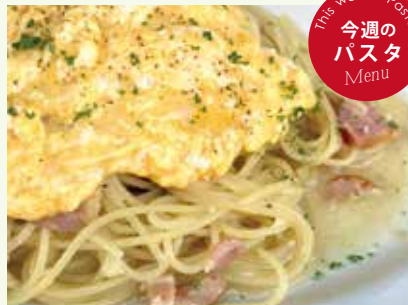
ふわふわ卵とベーコンの 白ワイン風味 パスタ