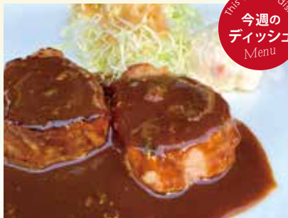
ポークヒレ肉のソテー グリーンペッパーソース