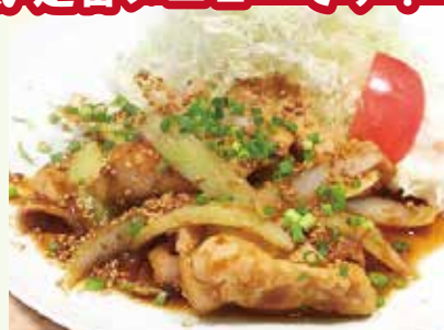
ポークジンジャー