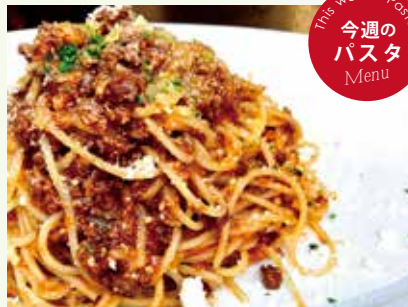
ラグーミートソース スパゲティ