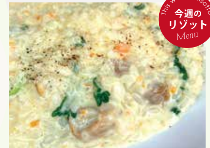
チキンと木ノ子の クリームリゾット