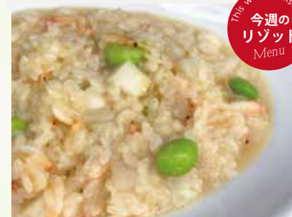
桜エビとカブの リゾット