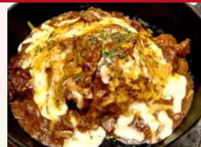
焼きチーズカレー