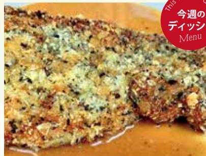
ポークカツレツ フォンドヴォークリーム