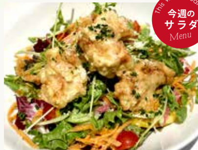
チキンフリットサラダ