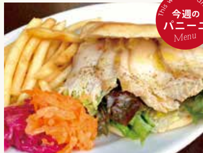
パニーニ チキンスモーク