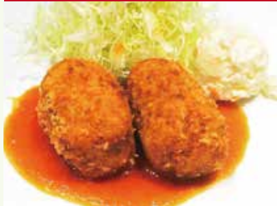
北海ウニ クリーム コロッケ