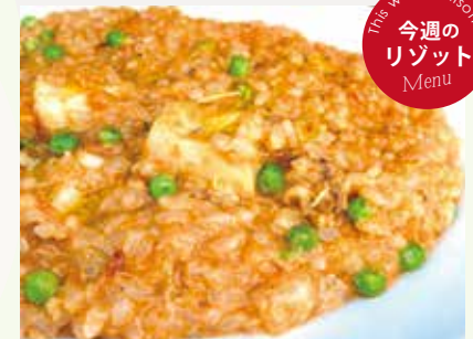
魚介のトマトクリーム リゾット