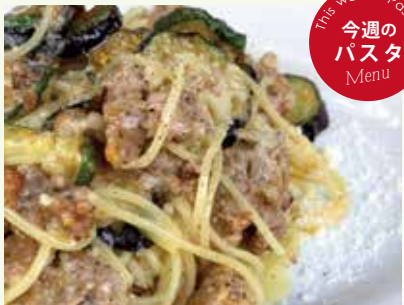
生ソーセージとズッキーニ ナスのコンタディーナパスタ