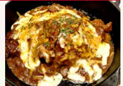
焼きチーズカレー