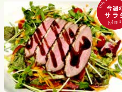
鴨スモークサラダ