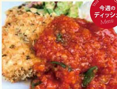
カジキマグロのフライ トマトバジルソース