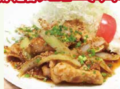
ポークジンジャー