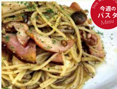
木の子とベーコンの モンターニャ パスタ