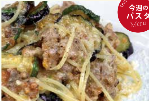
挽肉とズッキーニ ナスのコンタディーナパスタ