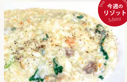
鴨スモークと木ノ子のリゾット