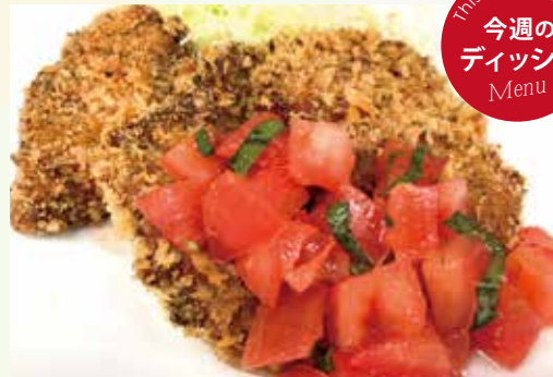
カツオのフリット ブルスケッタソース