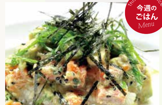
サーモンとアボカドのポキ