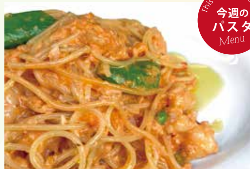
海老のトマトクリーム スパゲティ