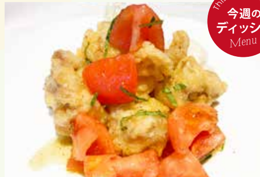
チキンチーズフリット フレッシュトマトとバジルのソース