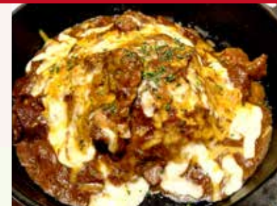
焼きチーズカレー