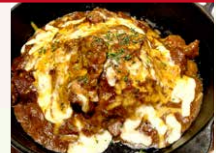
焼きチーズカレー