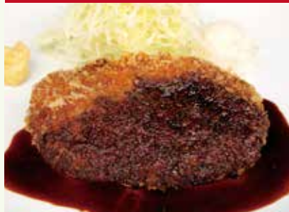
肉汁たっぷりワイン屋さん メンチカツ 赤ワインソース