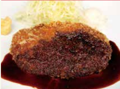
肉汁たっぷりワイン屋さん メンチカツ 赤ワインソース