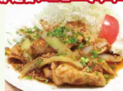
ポークジンジャー