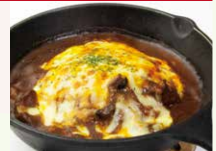
焼きチーズカレー