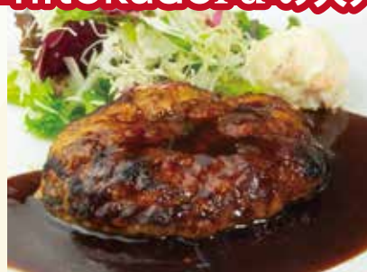
ハンバーグ デミグラスソース or 和風ソース