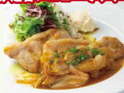
ポークジンジャー