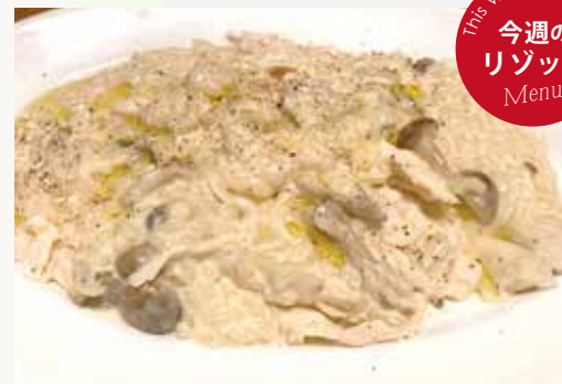
蒸し鶏と木の子の チーズリゾット