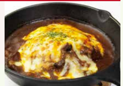
焼きチーズカレー