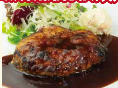
ハンバーグ デミグラスソース or 和風ソース