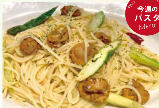
帆立の軽いスモークと アスパラのスパゲティ