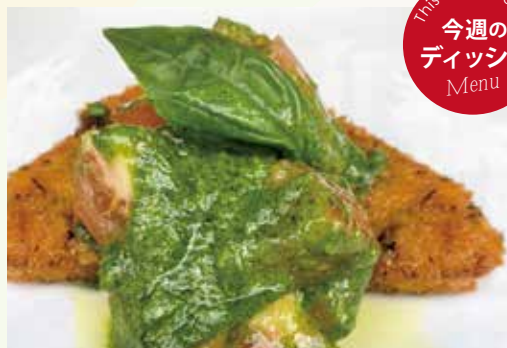
メカジキのフリット ジェノベーゼソース