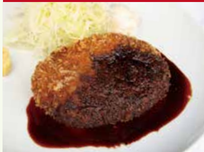
肉汁たっぷりワイン屋さん メンチカツ 赤ワインソース