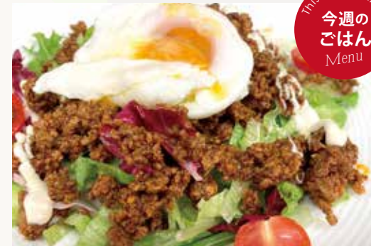
野菜たっぷりタコライス