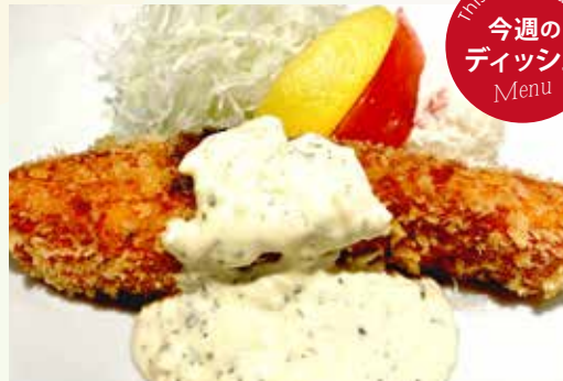
サーモンフライ タルタルソース